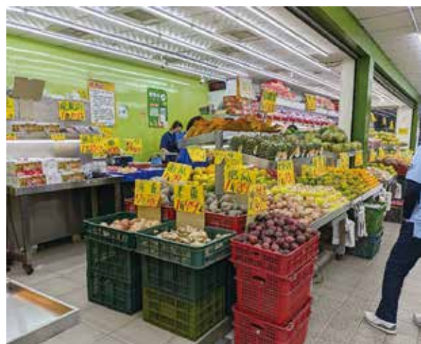
朝の散歩で見つけた果物屋

3日目、夕食を終え、買い物をしてホテルに戻る途中、たまたま出会った現地の方（日本語がお上手でした）には、台北の奥深い文化を学ぶことができる場所へ案内していただき、いろいろと教えて頂くことができました。日本と台湾の日常生活の文化や風習の違い、また共通点も考えられる機会となりました。この日は、台湾式足つぼマッサージ店にも行くことができ、台北最後の夜を存分に満喫できました。