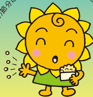
大阪民間共済会キャラクター “きょうちゃん”