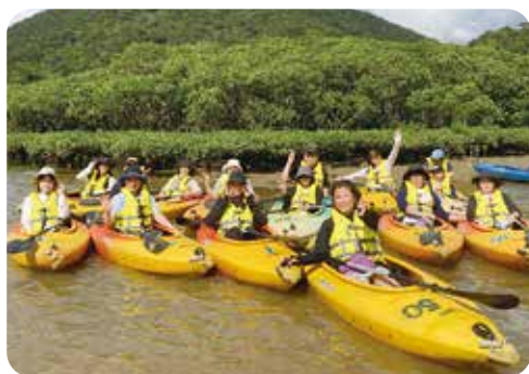
マングローブパークでのカヌー体験

さて2日目は「黒潮の森マングローブパーク」にてドキドキのカヌー初体験! ライフジャケットを着用後、カヌーを漕ぐパドルの使い方の説明を受け、いよいよ出発。思ったより、スムーズに進むなあと考えたのも束の間。原生林の元に戯れる珍しいシオマネキというカニ見たさに端によっていくとメヒルギやオヒルギという常緑樹にぶつかってしまったり、リュウキュウアユなど泳いでいないかなと水面を覗いてみるとアレアレどこに流れていくの? と思い通りに進まず悪戦苦闘。でも、マイナスイオンに包まれストレス発散、すがすがしい気分になりました。