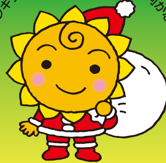
大阪民間共済会キャラクター “ぎょうちゃん”