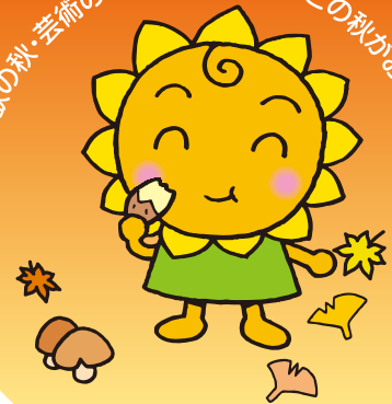
大阪民間共済会キャラクター “ぎょうちゃん”