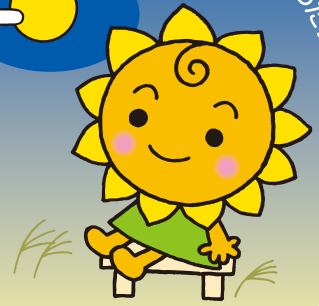
大阪民間共済会キャラクター "きょうちゃん"