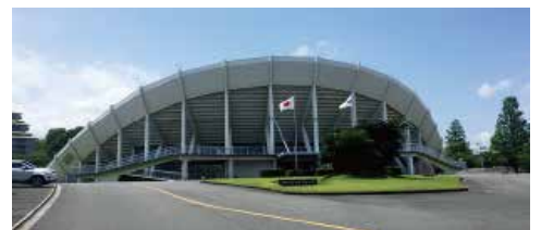
会場：パナソニックアリーナ