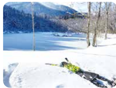
新雪の上に倒れ込んで、 フカフカひとりじめ