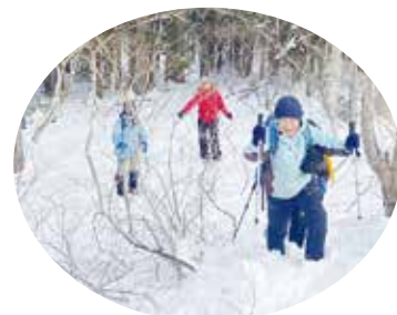
雪歩きが大好きな 森ガイドの仲間たち