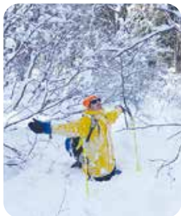
体の半分が雪に埋まった 身長 190cm の夫

さて、今年は暖冬とは言われていますが、信濃町以北～日本海側はそれなりの積雪があり、気温がマイナス10度を下回る日もあります。