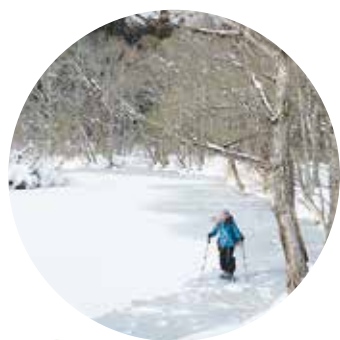
キンキンに凍った御鹿池

冬は特に室内にこもりがちになるので、体も心もカチカチにかたくなってきますよね。そんなときにはぜひ心身をほぐしに森に遊びに来ていただきたいです。 (よし)