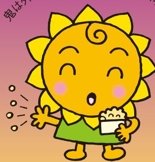
大阪民間共済会キャラクター “きょうちゃん”