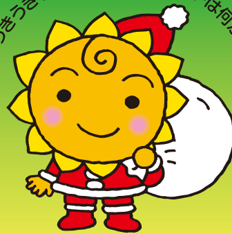
大阪民間共済会キャラクター “きょうちゃん”