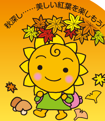
大阪民間共済会キャラクター "きょうちゃん"