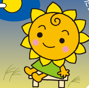
大阪民間共済会キャラクター "きょうちゃん"