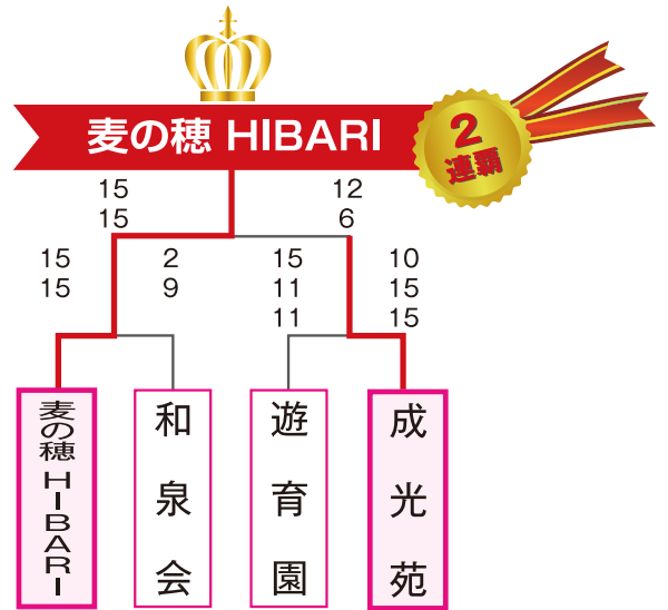
《決勝トーナメント》