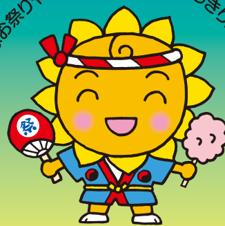
大阪民間共済会キャラクター “きょうちゃん”