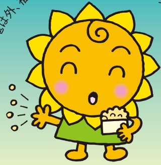
大阪民間共済会キャラクター “きょうちゃん”