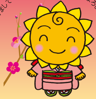
大阪民間共済会キャラクター “きょうちゃん”