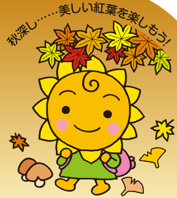
大阪民間共済会キャラクター “きょうちゃん”