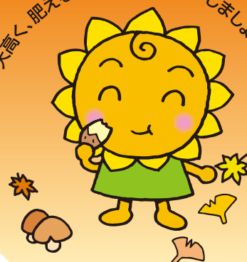
大阪民間共済会キャラクター “きょうちゃん”