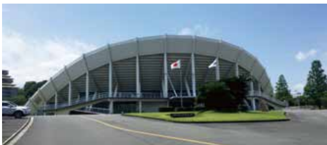
会場：パナソニックアリーナ