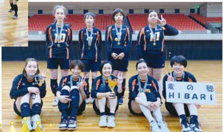
優勝 麦の穂 HIBARI