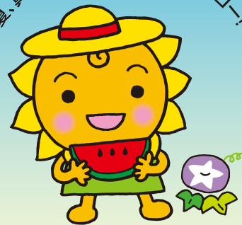
大阪民間共済会キャラクター “きょうちゃん”