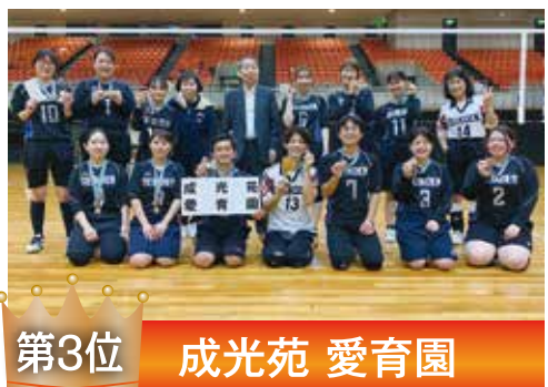
第3位 成光苑 愛育園