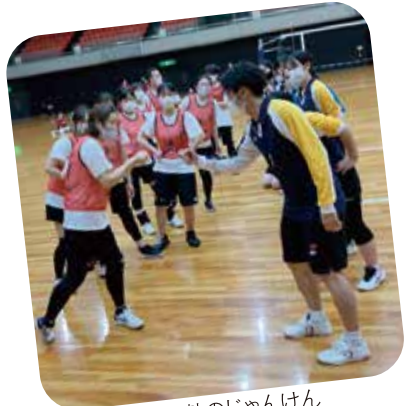
白熱のじゃんけん