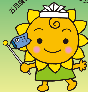
大阪民間共済会キャラクター “きょうちゃん”