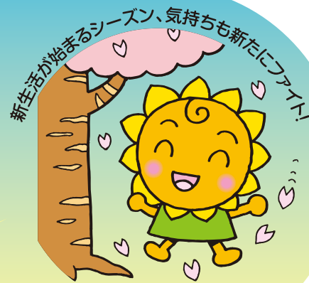
大阪民間共済会キャラクター “きょうちゃん”