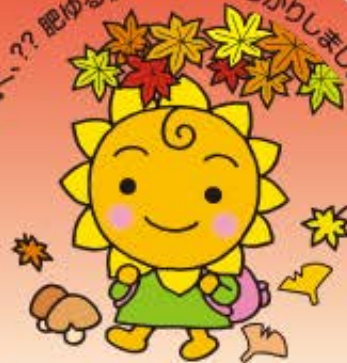
大阪民間共済会キャラクター "きょうちゃん"