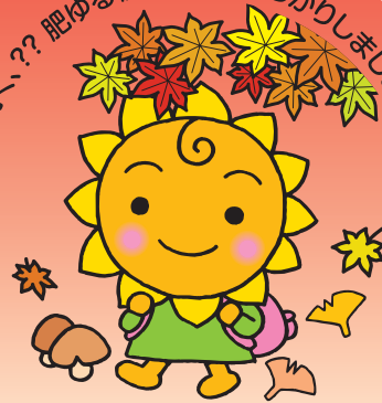
大阪民間共済会キャラクター "きょうちゃん"