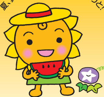
大阪民間共済会キャラクター “きょうちゃん”