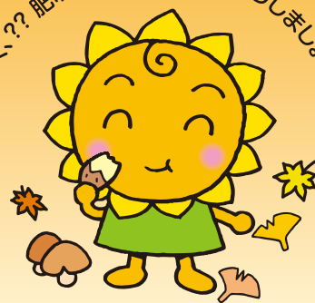
大阪民間共済会キャラクター “きょうちゃん”