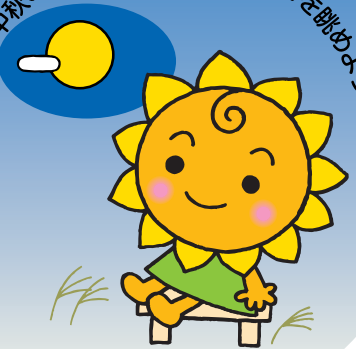
大阪民間共済会キャラクター “きょうちゃん”