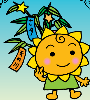
大阪民間共済会キャラクター 「きょうちゃん」