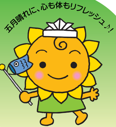
大阪民間共済会キャラクター “きょうちゃん”